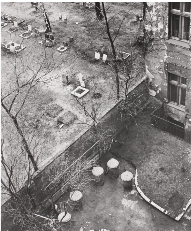
Manfred Paul - Hinterhof/Friedhof/Lychener Straße Berlin, 1979, Silbergelatineabzug, printed 1979 20 x 24 (30 x 40)

wir freuen uns, Ihnen hiermit die Verlängerung unserer Ausstellung „Manfred Paul – Berlin Nordost“ mitzuteilen. Aufgrund des gestiegenen Interesses beim Publikum zeigen wir die Zusammenstellung der drei Werkzyklen des Berliner Fotografen aus den Jahren 1970 – 1990 noch bis zum 6. Juli.