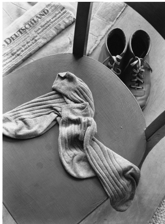
Manfred Paul – Socken Silber Gelatine Print, 1985 Edition 2/9 20 x 24 (30 x 40), © Manfred Paul