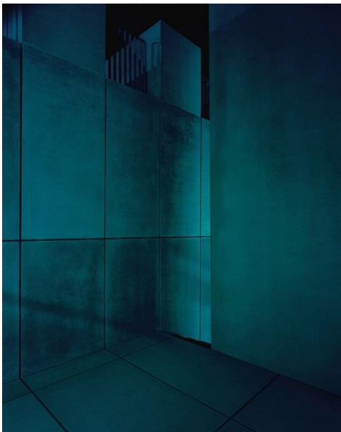
3. Julien Lescoeur, Sans-titre, 2013, Cycle: Velvet Doom. C-Print, 115 x 150 cm