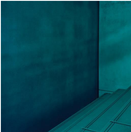
2. Julien Lescoeur, Sans-titre, 2013, Cycle: Velvet Doom. C-Print, 50 x 50 cm