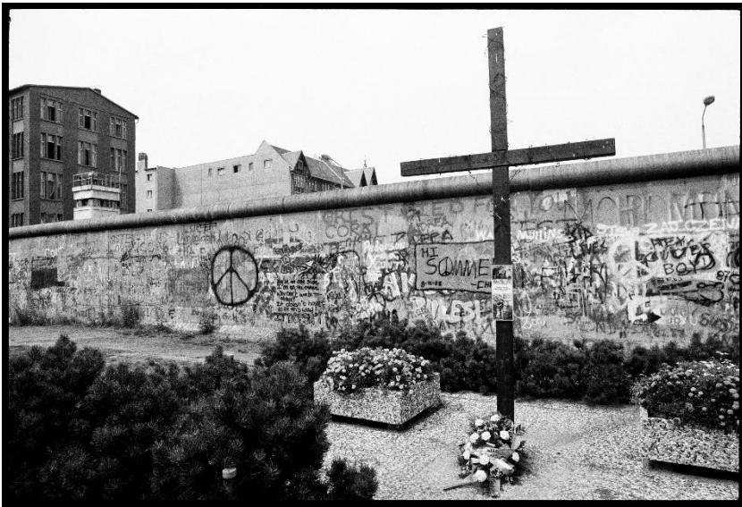
3. Patrick Tourneboeuf Zyklus/ Cycle: Berlin 1988 Titel/Title: Berlin #121 Silbergelatine Abzug/ silver gelatin print Printed 1988