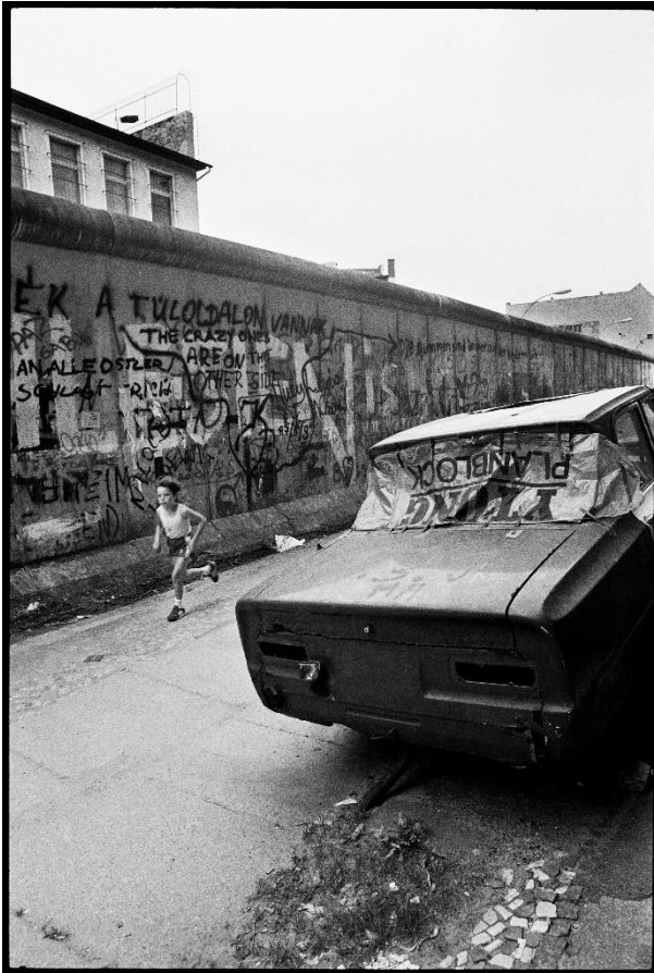
4. Patrick Tourneboeuf Zyklus/ Cycle: Berlin 1988 Titel/Title: Berlin #123 Silbergelatine Abzug/ silver gelatin print Printed 1988